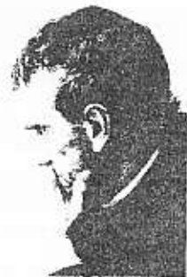
พ่อบอสโก

พระเจ้าทรงมั่งคั่ง และพระทัยกว้างขวางอย่างไม่มีขอบเขต ไนสูานะที่ทรงเป็นผู้มั่งคั่ง พระองค์สามารถที่จะตอบแทน ทุกสิ่งที่ทำเพราะความรักต่อพระองค์ และไนสูานะที่ทรง เป็นพระบิดาที่พระทัยกว้างขวางอย่างไม่มีขอบเขต พระองค์ทรงปูนบำเหน็จอย่างเต็มที่ ให้ทุกกิจการ แม้เล็กน้อย ที่เราทำเพราะเห็นแก่ความรัก